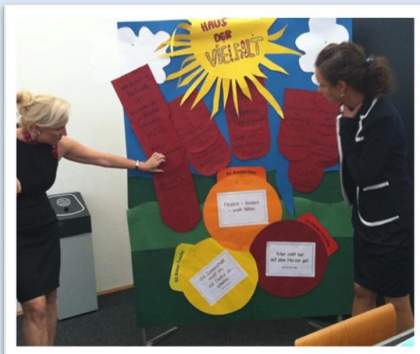
Gemeinsam galt es, ein „Haus der Vielfalt“ zu planen, an welchem es die nächsten zwei Jahre weiterzubauen gilt...

„Wir bauen gemeinsam ein Haus der Vielfalt“ – so das Motto, welches sich durch die Kick-off-Veranstaltung zog. So war es schließlich Aufgabe der beteiligten Lehrerkollegien, in Gemeinschaftsarbeit ein Dach für dieses Haus kreativ zu gestalten und ihre Wünsche und Erwartungen an das Schulentwicklungsvorhaben zu formulieren. Dabei wurde ganz deutlich,