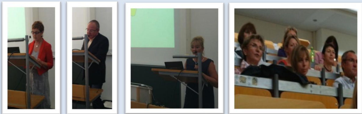
Die Schulleitungen der beteiligten Grundschulen Alkofen, Aunkofen und Ritter-Tuschl Vilshofen bei ihrer Schulpräsentation, welche mit ihrem gesamten Kollegium zur Auftaktveranstaltung erschienen waren

Im Rahmen der Auftaktveranstaltung stand insbesondere auch das Kennenlernen der Projektpartner und beteiligten Schulen untereinander im Mittelpunkt, was durch eine Kurzpräsentation der Schulen, ihrer Rahmenbedingungen, des Schulprofils und ihrer pädagogischen Zielsetzung erfolgte.