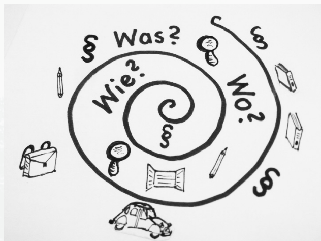
Ch. W. '13

Der Übergang von der ersten Phase der Lehrer_innenbildung, dem Studium, in die zweite, das Referendariat, ist für die meisten angehenden Lehrkräfte mit vielen offenen Fragen und Unsicherheiten verbunden.